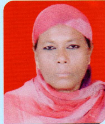
मा.शिकलगर बिरिमल्ला अल्लाब